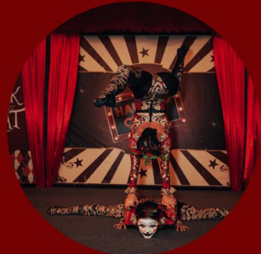
L'art du cirque