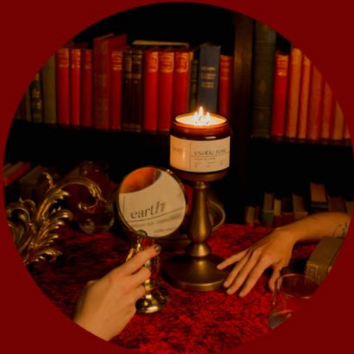
L'histoire de l'art